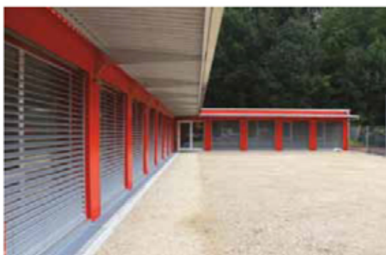
Le bâtiment en forme de L est moderne et «Minergie P»