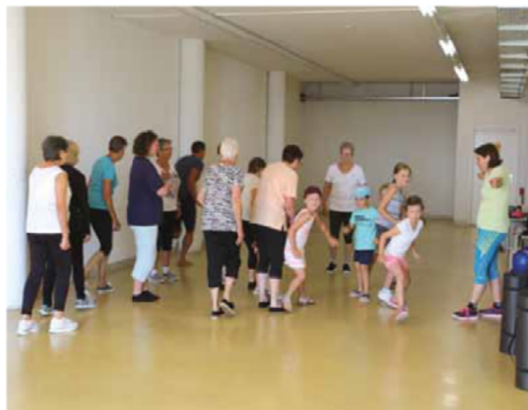
Lors d'une séance exceptionnelle au début des vacances, plusieurs enfants ont également participé au cours, dont cinq venaient de la structure parascolaire La Noisette Magique à Vaumarcus