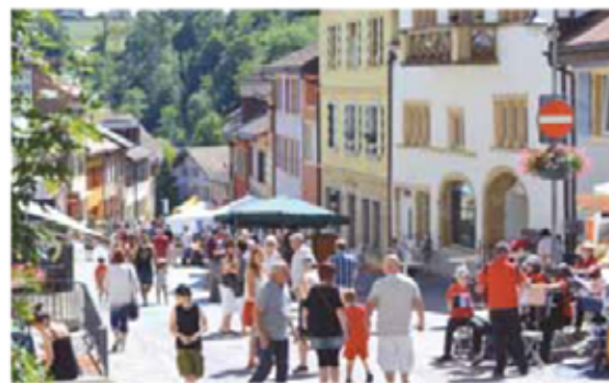
Souvenirs de la journée des «Pavés en folie» de juin 2017