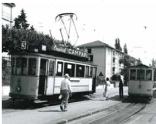
Le Britchon à Corcelles le 3 juillet 1976.