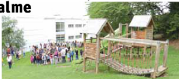
Toutes les classes se place pour la photo...

Le Comité d'école de Saint-Aubin-Sauges a inauguré peu de temps avant les vacances scolaires la nouvelle place de jeux et l'espace calme du collège des coccinelles de Saint-Aubin. Après une petite allocution d'Olivier Boschung, président du CEC de St-Aubin-Sauges, la parole a été donnée aux enfants qui ont terminé par un grand M E R C I tous ensemble! Le collège avait en juin 206 élèves répartis dans 10 classes Harmos de 1 à 8.