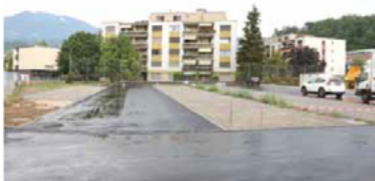
Le parking payant la journée offre 65 places (24 de plus que l'ancien)

La construction est composée de modules préfabriqués de qualité en bois de provenance suisse, dotée du standard «Minergie P» (=économie d'énergie). Le choix de la forme s'est porté sur un «L» afin de définir une cour privative pour la structure qui sera sécurisée par un grillage afin que les enfants ne puissent pas sortir sans un contrôle du personnel. Le parking côté route nouvellement créé propose 65 places payantes durant la journée. Un terrain multisport attenant à la structure d'accueil a également été construit et profitera à tous les «boudryens». Bref, une nouvelle zone agréablement réaménagée.