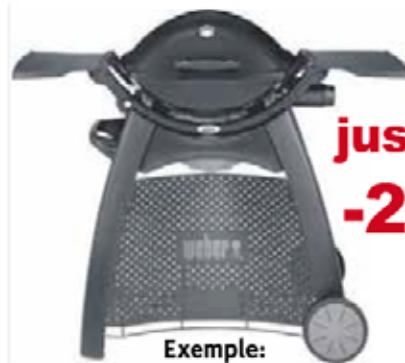
Exemple: Modèle Q-2200