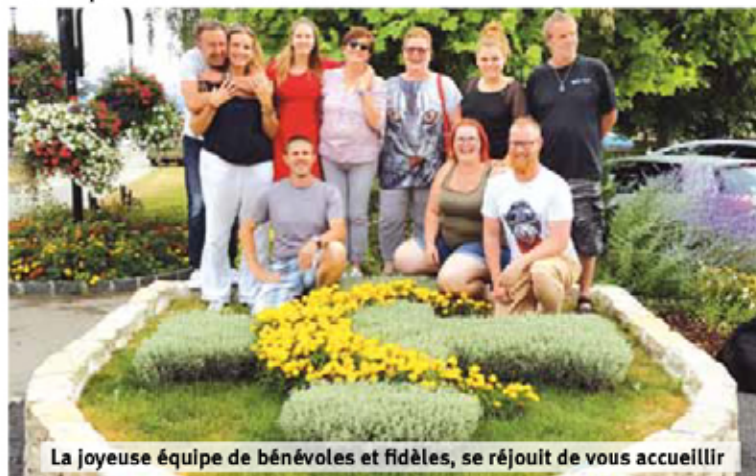
La joyeuse équipe de bénévoles et fidèles, se réjouit de vous accueillir

Organisé par la société de développement de Bèvaix