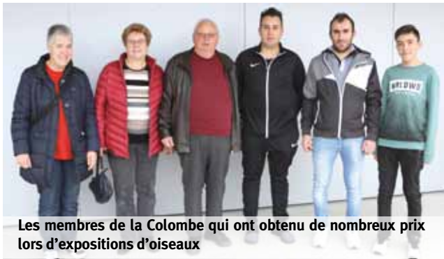
Les membres de la Colombe qui ont obtenu de nombreux prix lors d'expositions d'oiseaux