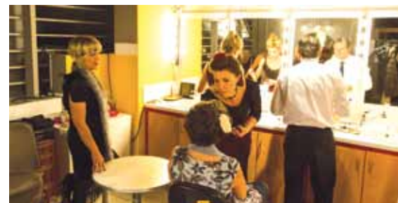
Dans les loges, maquillage, etc...

Deux journées «portes ouvertes» ont été prévues à l'attention de notre fidèle public et de toute personne, adulte ou enfant, intéressée par les activités du spectacle. Chacun pourra visiter «l'envers du décor», qu'il s'agisse des coulisses, de la régie, des loges où les acteurs prennent possession de leur personnage avec leur costume, coiffure et maquillage, ou encore des stocks de costumes et de matériel de décors. Une rétrospective des 35 spectacles présentés depuis la création de la troupe sera également présentée, sous forme de photos, d'éléments de décors ou de mannequins costumés. D'autres belles surprises vous attendent, comme un concours sous forme de «quiz» ou des grimages pour les enfants (de tous âges...). Alors venez nombreux découvrir votre théâtre du Plan-Jacot, les 15 juin et 5 octobre prochains, entre 10h et 16h !