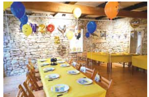
Le Trin-Na-Niole un lieu bien situé au centre du village, parfait pour une fête de famille, conférence ou séance atelier, il y a même des WC