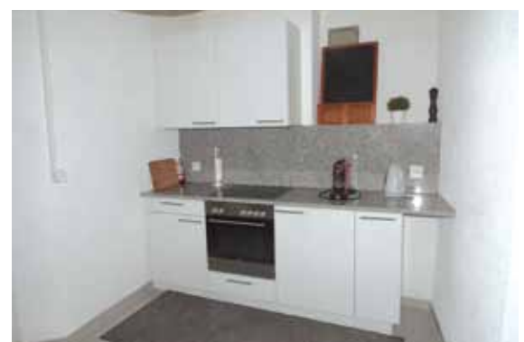
La cuisine du Trin-Na-Niole est bien équipée