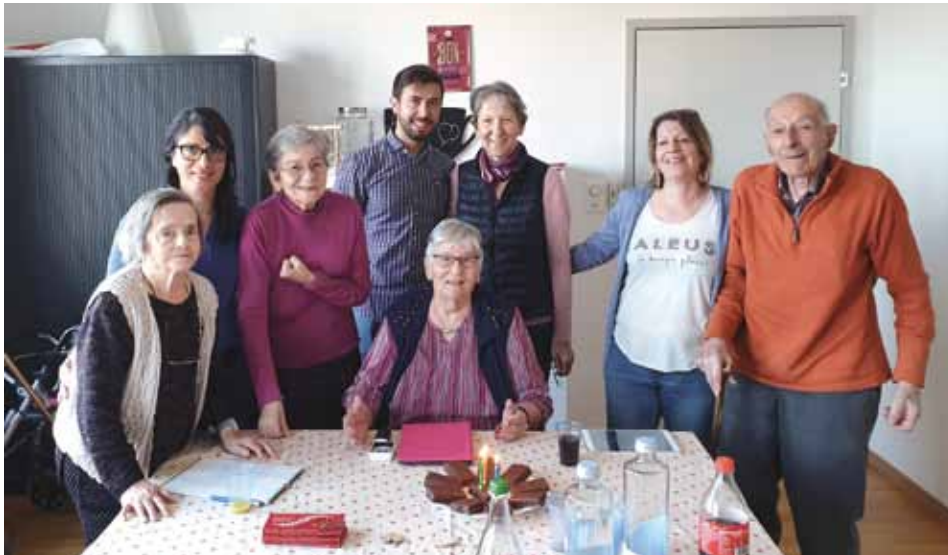
Bonne ambiance à La Fontanette lors des journées «foyer de jour»

L'accueil de jour s'adresse aux personnes âgées qui vivent à domicile et souffrent de dépendances physiques et/ou de troubles de la mémoire. Tout un catalogue d'activités est concocté par les foyers de jour. Les prestations d'accompagnement social, thérapeutique et de bien-être, de soins et d'animation socioculturelle sont de plus adaptées à chaque situation et proposées selon les envies du bénéficiaire. Elles visent à renforcer son autonomie et ses capacités pour qu'il puisse rester à domicile le plus longtemps possible et dans de bonnes conditions.