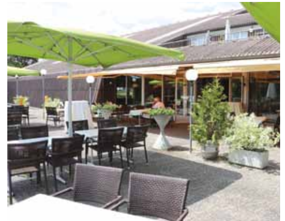
La grande terrasse accueillante, calme et ombragée.

facebook: Restaurant Le Sporting & Centre Sportif