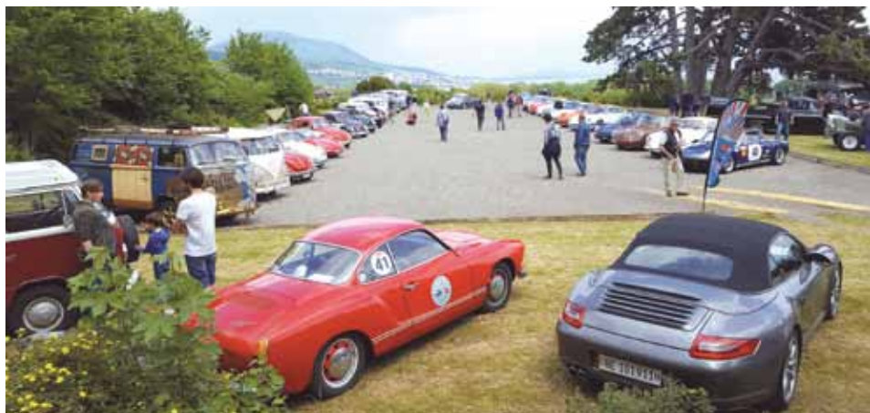
Une belle variété de bolides et de voitures mythiques ont fait rêver le public.