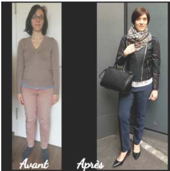
Exemple de relooking avant et après

AF Style Beauty/Make-up/Look, Anouchka Fasel, ch. des Prisettes 6, 2017 Boudry Tel. 079 206 54 50 - Email. contact@af-style.ch