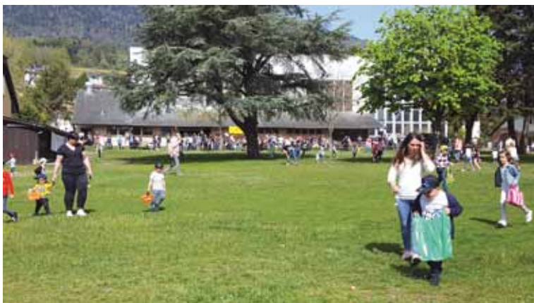
Parents et enfants à la recherche des petits œufs bien dissimulés.

Toujours très attendu après le repas, le concours de lancé d'œufs par équipe s'est déroulé comme d'habitude dans une ambiance très festive, avec des beaux prix à la clé.