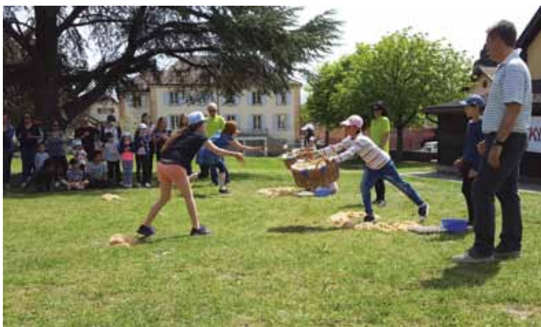
Petits et grands ont fait preuve de rapidité et dextérité pour lancer et réceptionner les œufs dans le panier...sans les casser. A chacun sa technique.