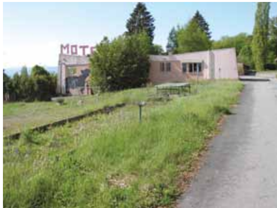
L'emplacement du futur magasin Lidl de Bevaix