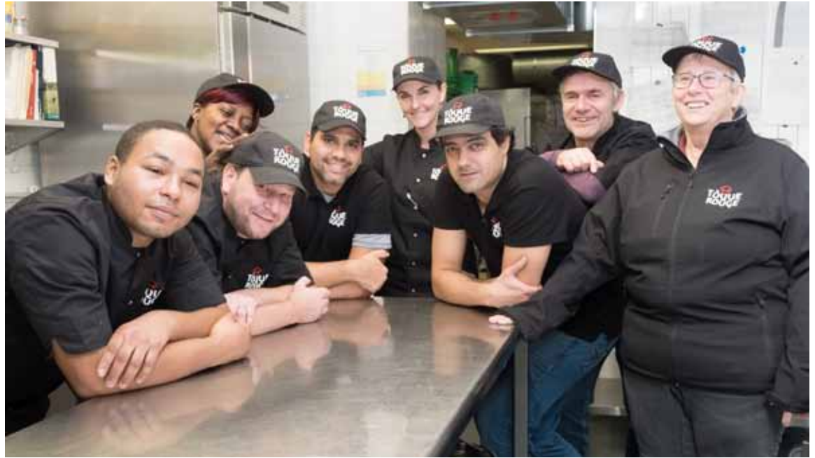
Une équipe dynamique à votre service

Les commandes ou annulations sont possible jusqu'à 9h le jour même et La Toque Rouge propose les alternatives suivantes: sans