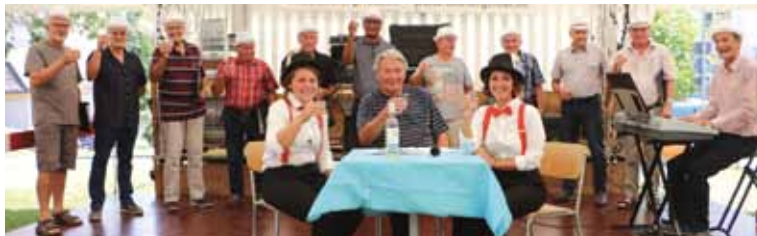
Le chœur d'hommes «Le Vignoble» lors de la Revue pour la 40 e Miaou en 2019

suit avec la CPN, La Chanson du Pays de Neuchâtel, sous la direction de Michel Dumonthay. Une telle programmation pour garantir aux spectateurs une soirée définitivement très agréable. Tout au long de la soirée, une cantine vous permettra de vous régaler entre amis et en famille. Les membres de la chorale se réjouissent de vous accueillir!