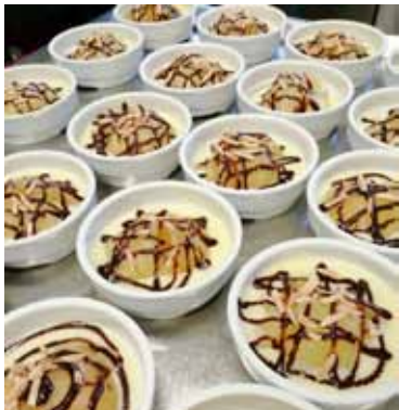
Des bons petits plats

La Toque Rouge Rue Louis-Favre 1 2000 Neuchâtel Tél. 032 721 11 16