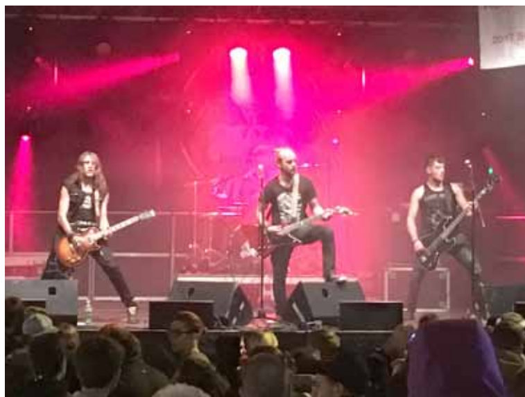
Les quatre musiciens du groupe Rebel Duck lors d'un concert à la Boudryssia en 2017. (Archives LHI)

Un geste sympathique pour soutenir cette association australienne qui est active depuis plus de 30 ans dans la réhabilitation et la préservation de la faune locale.