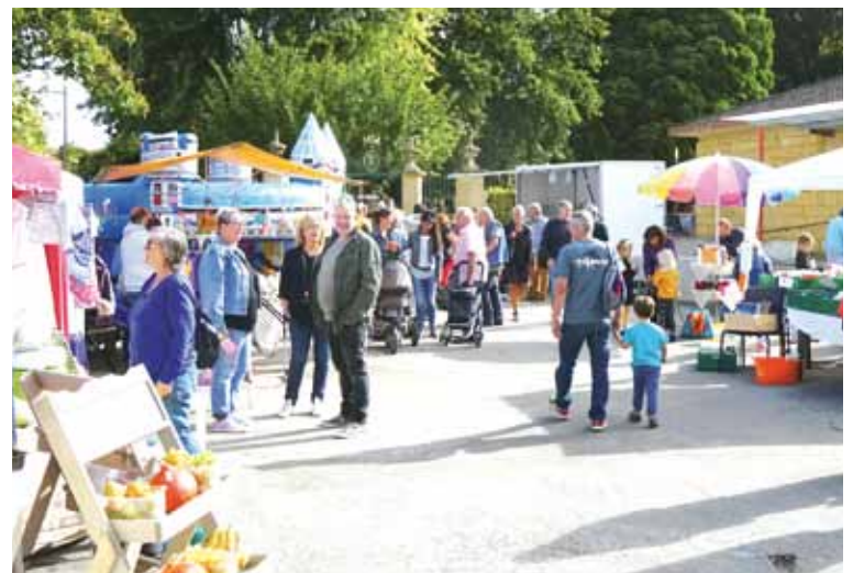
Lors d'un des premiers marchés en 2018

Dans les communes de Bevaix, Boudry, Cortailod, Bôle