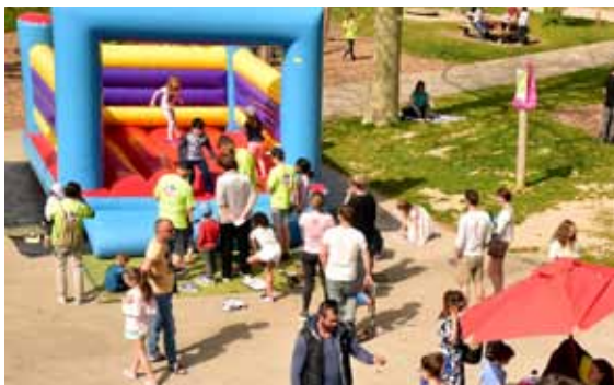
Souvenirs de l'édition 2019

Venez nombreux! Tout est gratuit grâce à plusieurs donateurs.