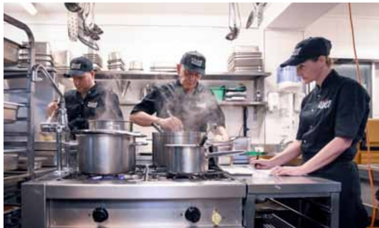
Préparation des menus, 7 jours sur 7