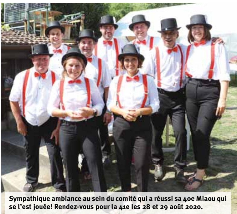
Sympathique ambiance au sein du comité qui a réussi sa 40e Miaou qui se l'est jouée! Rendez-vous pour la 41e les 28 et 29 août 2020.