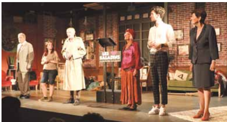
La petite troupe du jour a animé la pièce comme des pros