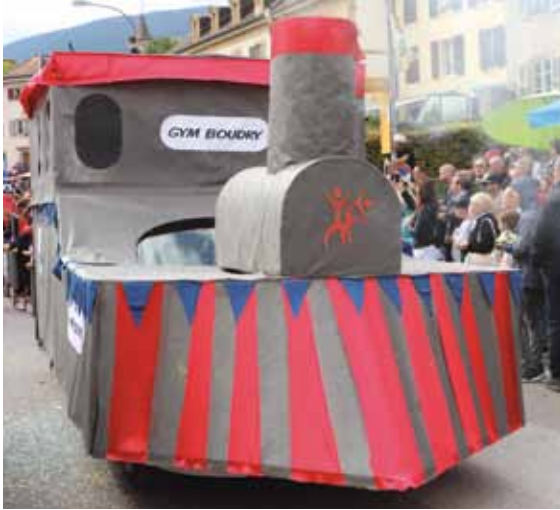
Joli char de la gym de Boudry.

Les prévisions de la météo n'étaient pas trop favorables, mais au final malgré un temps frais, pas de grosses pluies et même des rayons de soleil lors du dimanche. Une belle fête bien animée avec une participation appréciée de la commune invitée: Cressier. Plus de 20'000 spectateurs pour le grand cortège du dimanche sur le thème des inventions, avec de jolies surprises: voici quelques images: