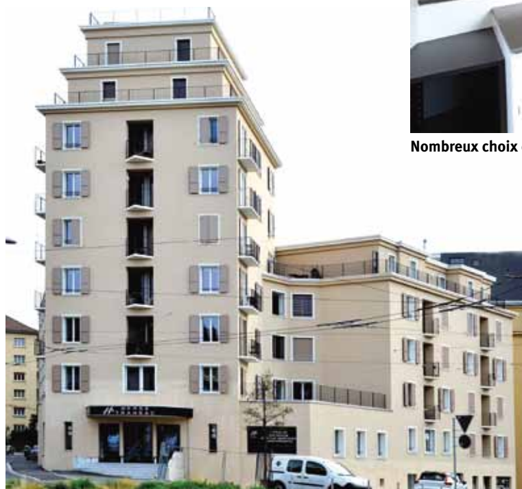
Fenêtres (Une réalisation à Neuchâtel)

Faire appel à la Menuiserie Vauthier SA, c'est la garantie d'un travail de qualité exécuté par des personnes de notre région.