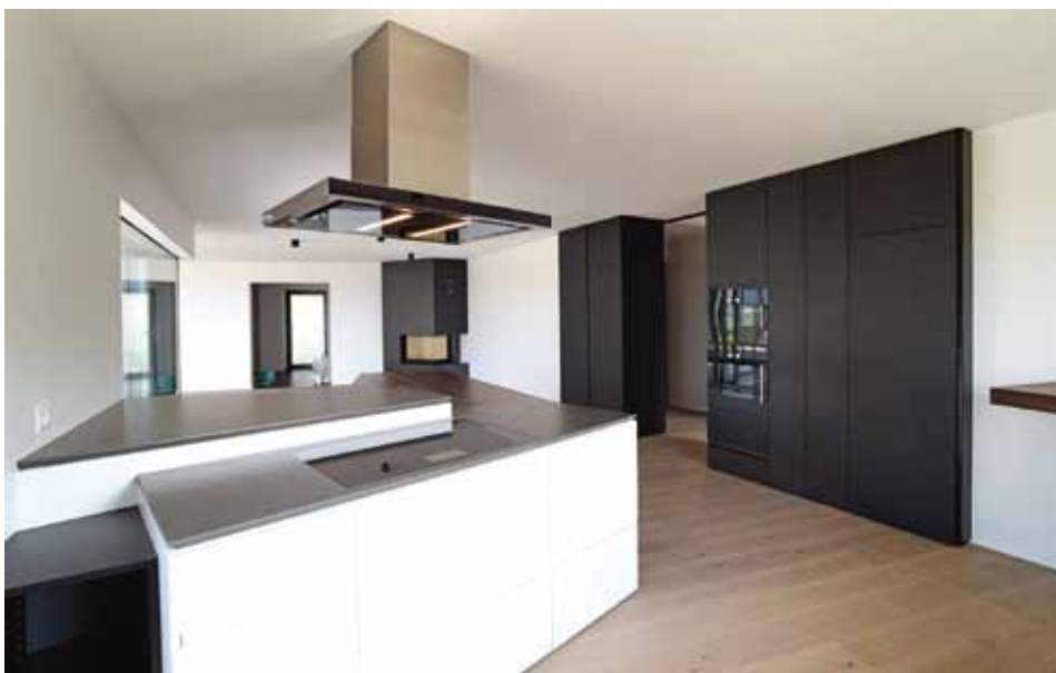
Nombreux choix de cuisines pour tous les goûts (Photo: cuisine réalisée sur-mesure)