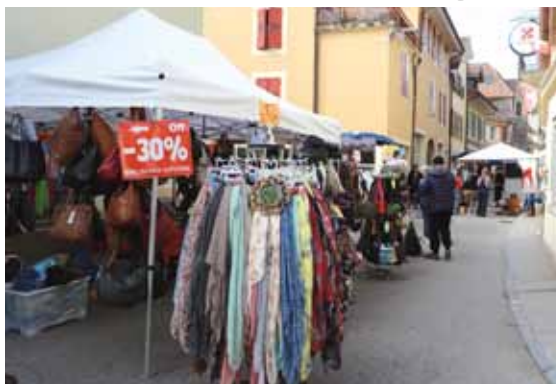
La Braderie c'est l'occasion de faire des bonnes affaires et découvrir des produits de la région.