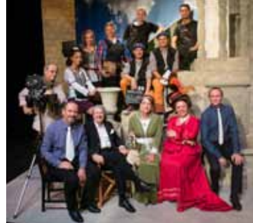
Les comédiens de SILENCE, ON TOURNE, installés dans le décor de Jean-Marie Liengme

Location: → www.lapassade.ch ou en appelant le 032 841 50 50, du mercredi au vendredi, de 15 à 18h.