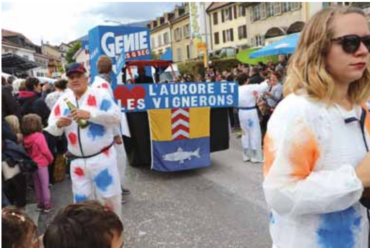
Le Chœur mixte l'Aurore et les vigneron ont trouvé le Génie pour ne plus être à sec! (2e prix des chars).