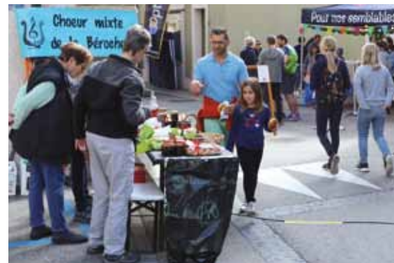
Présence de sociétés locales