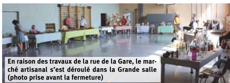
En raison des travaux de la rue de la Gare, le marché artisanal s'est déroulé dans la Grande salle (photo prise avant la fermeture)

Le dernier lâché de ballons de la Miaou (ballons biodégradables même la ficelle). Cette activité ne sera plus reconduite dans les prochaines «Miaou».