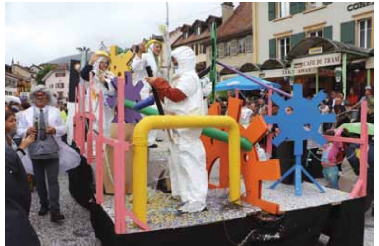
Le char du comité de la Boudrysia accompagné par les membres du Conseil communal