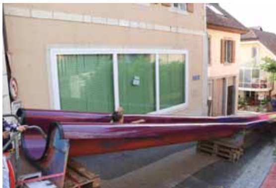
Le toboggan géant du Kiwanis en haut du chemin du Bayard