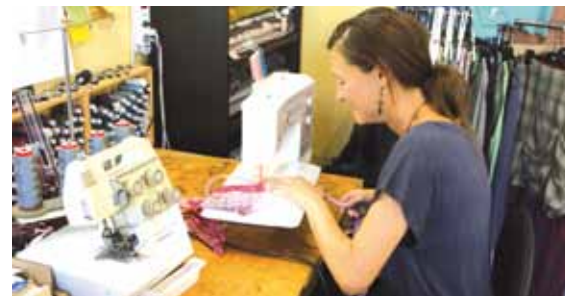
Souvenir des Biviades 2018, consacrées aux savoir-faire des artisans du village. (Photo chez Suki, créatrice de mode).

Quand on connaît la qualité des animations préparées par le comité des Biviades, on ne peut qu'agender cette date.