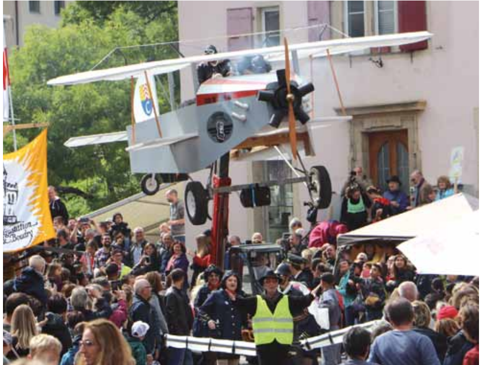
Un avion dans les rues de Boudry, c'est la Cressier Flying Academy, ce char (volant) a nettement remporté le 1er prix des chars!