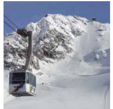
Le Mont-Fort à 3330 m, reste une valeur sûre du secteur des 4 Vallées

Samedi 28 sept. à 20 heures et dimanche 28 sept. à 17 heures représentations de l'Opéra Par-ci Par-là.