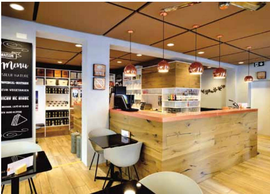
Agencement d'un restaurant (Au Moka à Neuchâtel)

L'entreprise qui a fêté ses 40 ans en août 2018, propose aussi un service d'entretien pour professionnels mais également pour les privés. Rapide et efficace, il s'adapte parfaitement à chaque situation. Quatre collaborateurs, tous professionnels de la branche pourront résoudre vos problèmes de réparation ou d'entretien.