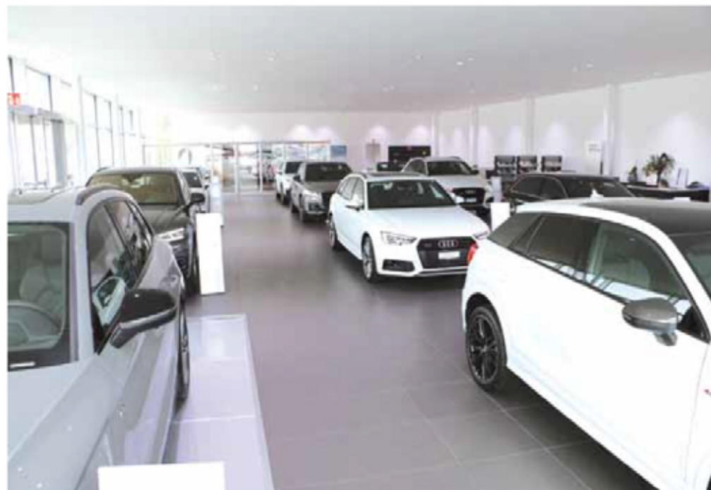
Un showroom pour chaque marque (photo: celui d'Audi) à Yverdon

A La Chaux-de-Fonds: Crêtets 90, 2300 La Chaux-de-Fonds, tél. 032 925 92 92