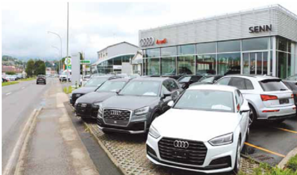
Le garage d'Yverdon est idéalement placé à la sortie de la localité en direction de Grandson

Concessionnaire des marques VW, VW Véhicules Utilitaires, Audi et Seat (à Neuchâtel seulement), l'entreprise fidélise plus de 20'000 clients, commercialise près de 3'000 véhicules par année et reçoit 25'000 passages dans ses ateliers.