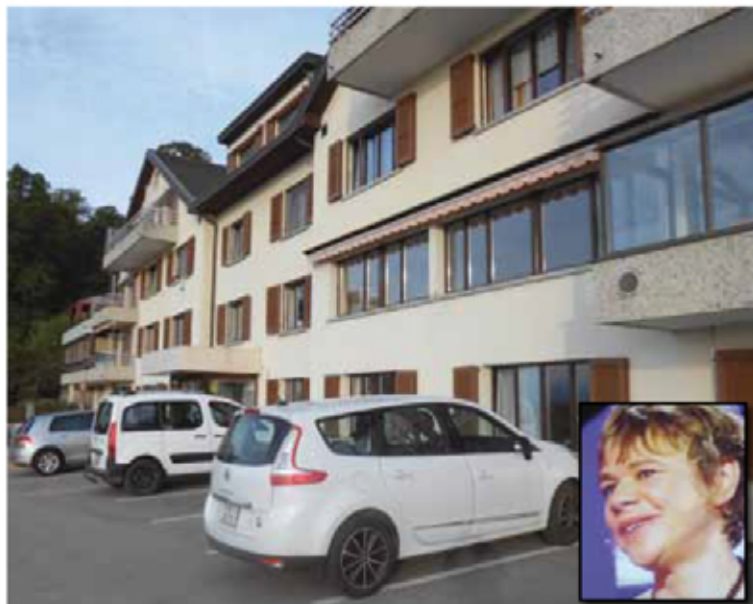
La Lorraine sur les hauts du village; en médaillon, Marianne, une des animatrices de la Lorraine