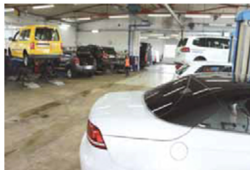
Un atelier spacieux et bien organisé