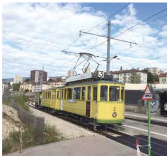
La composition complète du Britchon à l'arrêt de Serrières.