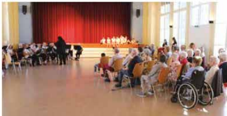
Les accordéonistes Le Rossignol de Gorges (avec l'Amitié de Bevaix), puis le Chœur mixte L'Aurore ont animé la partie récréative.