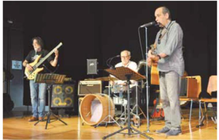
Le groupe 1,2,3 de Cortailod a ouvert la soirée