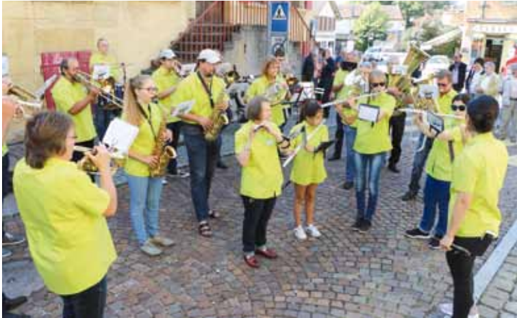
La fanfare Béroche-Bevaix en concert lors des Biviades 2018

ment, une manifestation telle que les Biviades basée sur la convivialité et la rencontre ne pourrait se dérouler dans de bonnes conditions sanitaires respectant les règles imposées par le Conseil fédéral et le SCAV, donc rendez-vous en 2022.