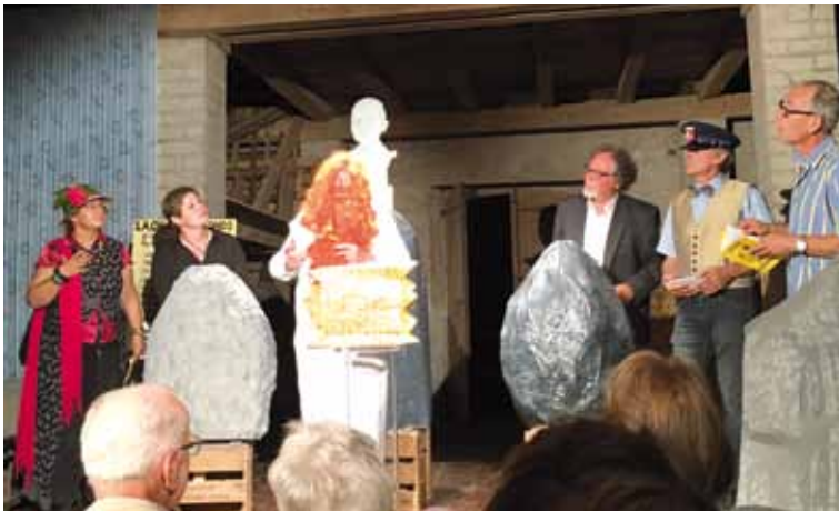
Souvenir des Biviades en 2016 qui s'étaient déroulées à Vauroux