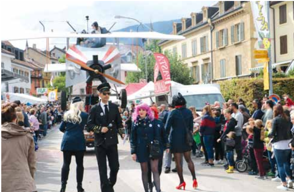
Souvenir de la 25 e Boudryisia en 2019.

Boudryisia étant une fête bisannuelle, donc rendez-vous pour la 26 e , les 8, 9 et 10 septembre 2023.