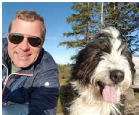
Otto et son maître sont détendus à propos de la saison des tiques.

Conclusion: une protection efficace contre les tiques, telle que celle proposée par «Psorinum vet. comp.», est également et surtout nécessaire pour les animaux de compagnie! «Psorinum vet. comp.» est disponible auprès des vétérinaires, des pharmacies et des drogueries.