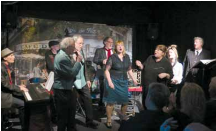
Souvenir du cabaret en 2019 (le bon temps avant la pandémie!)

Toute l'équipe se réjouit de vous retrouver bientôt, en pleine forme, pour cette nouvelle saison.