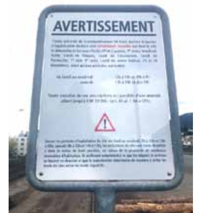
Toute activité de transbordement est strictement interdite le dimanche et jours fériés, ainsi que du lundi au vendredi de 12h à 13h et de 19h à 7h, et le samedi de 12h à 14h et dès 17h.

du texte est, malgré tout, le fruit d'un consensus entre la régie fédérale et la Commune de Milvignes.