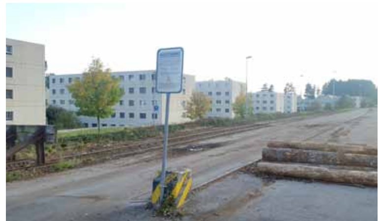
Les immeubles du chemin de la Scierie à proximité de la gare et des activités de transbordement de bois.

Suite aux conclusions du SENE, CFF Cargo implique également la responsabilité des exploitants de la voie de débord, soit CFF Infrastructures, des entreprises de transport de bois et des propriétaires. Ensuite de ces démarches, la Commune ayant atteint ses limites de compétence et l'application des mesures devant être ordonnées par le SENE, les autorités communales classent la pétition en août 2017.