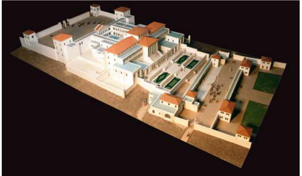
La maquette de la villa romaine au 3e siècle après J.-C. reconstitution hypothétique que l'on peut voir au Laténium à Hauterive

Devenu le siège des seigneurs de Colombier, personnalités régionales importantes, la résidence est transformée en château-fort avec un réduit