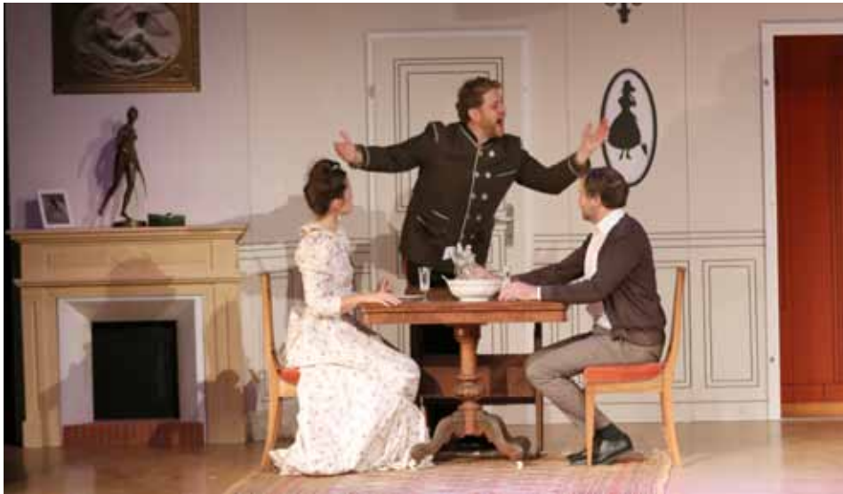
Lors d'une des premières représentations fin octobre, début novembre