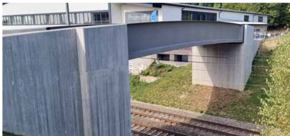
Le nouvel ouvrage reliant Boudry à Bôle au lieu-dit des «Bois-Coinchiez».

Afin d'éviter au maximum le trafic de transit entre Bôle et Boudry, des solutions ont été prévu à cet effet, comme la limitation de la vitesse à 20km/h à Bôle ainsi que des aménagements routiers afin de dissuader les automobilistes et ainsi de préserver aussi les piétons et amateurs de mobilité douce qui utilisent le pont.