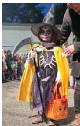
Une des gagnantes dans la catégorie 1 er et 2 e Harmos.

Après l'annulation en 2020 à cause du Covid, la Fête de la courge, organisé par le Parti libéral-radical de Milvignes, a eu lieu le mercredi 27 octobre dans la cour de la Maison de commune à Bôle. Au programme, un concours de sculpture de courge et de déguisement le plus original. Le jury avait fort à faire afin de déterminer les gagnants parmi les nombreux enfants inscrits au défilé. Pour les parents et accompagnants présents, une exquisite soupe à la courge était offerte à tous. Et pour fêter dignement Halloween, chaque enfant grimmé ou déguisé est reparti avec un petit cadeau.