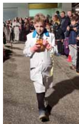
Les enfants ont fait preuve d'une grande originalité.