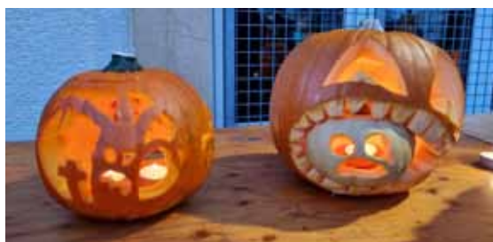
Des courges sculptées avec beaucoup de créativité.