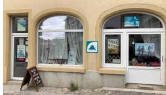
La boutique, rue du Château 11, au centre de Colombier

Vous y trouverez tous les accessoires et le matériel nécessaire pour réaliser vos créations, mais également des livres et catalogues. Laines et fils à tricoter et crocheter de toutes sortes, fils pour macramé, aiguilles KnitPro en bois de bouleau, aiguilles HiyaHiya, «punch needles», canevas, tissus et fils à broder sont quelques exemples des nombreux articles en magasin.