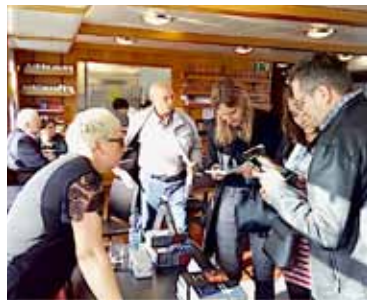
Lors de la 6 e édition