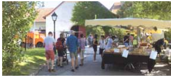
Souvenirs de l'édition 2019