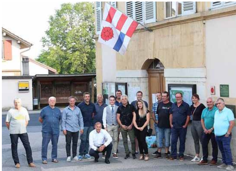
Ils se réjouissent d'aller à la rencontre de la population ces prochaines semaines afin de se présenter

rants politiques, 17 personnes enthousiastes se proposent de relever le défi avec des expériences variées représentant les 4 coins de la nouvelle commune. Ils proposeront leur candidature afin de constituer une des composantes d'équilibre dans la vie politique de la Grande Béroche.