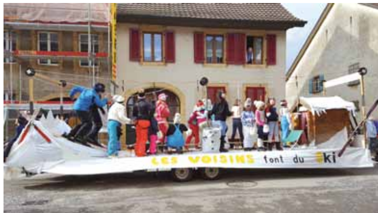
Souvenirs de la fête de 2019 qui avait pour thème «C'est déjà l'hiver»

cœur de reporter cette fête à 2021. Le thème prévu était «C'est la Jungle», alors donnons ren- dez-vous à Tarzan et autre Jane & compagnie au début du mois d'octobre 2021.