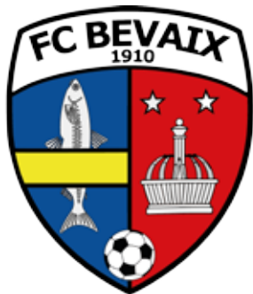
Nouveau logo du FC Bevaix

Devenu une vraie tradition pour le village et ses environs, le repas de soutien du FC Bevaix connaît un grand succès depuis de nombreuses années, une occasion conviviale de se rencontrer. Prévu initialement au mois de juin, le quinzième repas de soutien aura finalement lieu sous