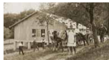
Le bâtiment principal en 1920 et 2020

N'oubliez pas qu'une alimentation variée et équilibrée vous apportera toutes les vitamines et minéraux nécessaires au bon fonctionnement de votre corps.