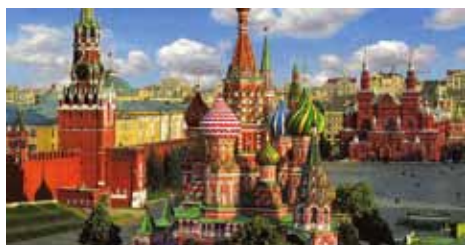
Le Kremlin de Moscou

passés à visiter Moscou et la croisière sur la Volga avec quelques sites remarquables, on découvrira quelques-unes des merveilles de Saint-Petersbourg et de ses environs. Cette conférence est ouverte à toutes et tous, gratuitement. Une collecte sera faite pour couvrir les frais. Merci de respecter les règles d'hygiène sanitaires.