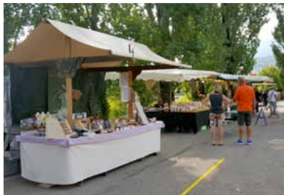
Lors du Marché des Saveurs en 2020