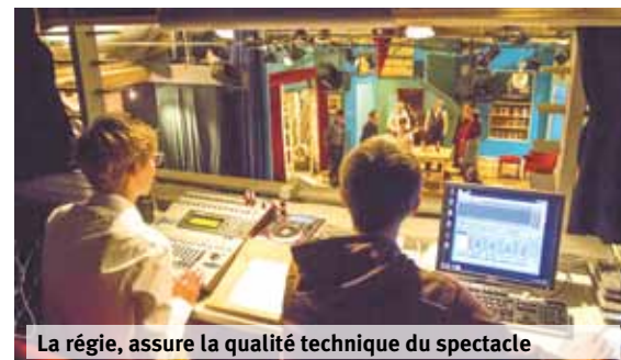
La régie, assure la qualité technique du spectacle

Merci à tous nos sponsors et en particulier à: