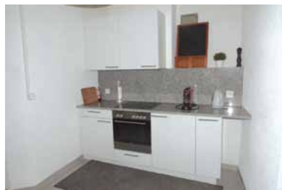
La cuisine du Trin-Na-Niole est bien équipée