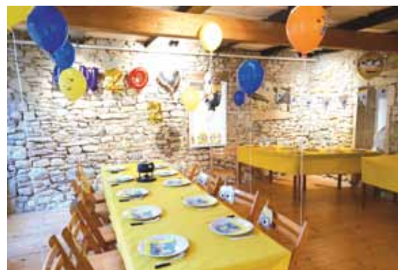
Le Trin-Na-Niole un lieu bien situé au centre du village, parfait pour une fête de famille, conférence ou séance atelier, il y a même des WC