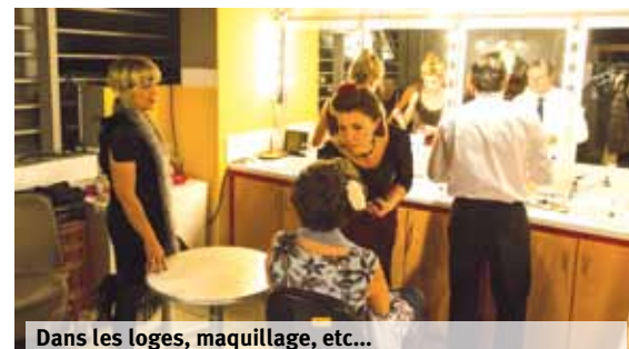
Dans les loges, maquillage, etc...

Deux journées «portes ouvertes» ont été prévues à l'attention de notre fidèle public et de toute personne, adulte ou enfant, intéressée par les activités du spectacle. Chacun pourra visiter «l'envers du décor», qu'il s'agisse des coulisses, de la régie, des loges où les acteurs prennent possession de leur personnage avec leur costume, coiffure et maquillage, ou encore des stocks de costumes et de matériel de décors. Une rétrospective des 35 spectacles présentés depuis la création de la troupe sera également présentée, sous forme de photos, d'éléments de décors ou de mannequins costumés. D'autres belles surprises vous attendent, comme un concours sous forme de «quiz» ou des grimages pour les enfants (de tous âges ...). Alors venez nombreux découvrir votre théâtre du Plan-Jacot, les 15 juin et 5 octobre prochains, entre 10h et 16h !