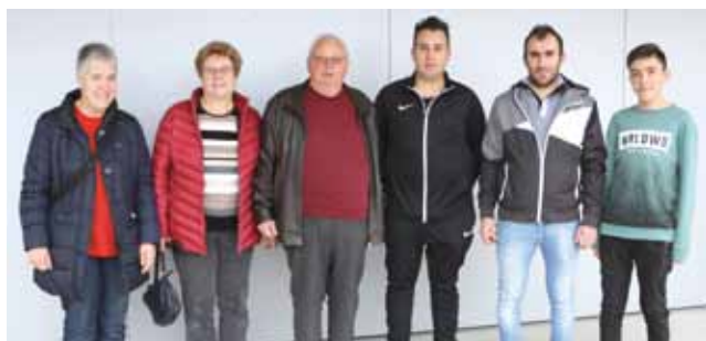
Les membres de la Colombe qui ont obtenu de nombreux prix lors d'expositions d'oiseaux