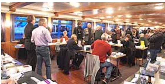
A bord du bateau «Le Fribourg» lors de l'édition 2018.