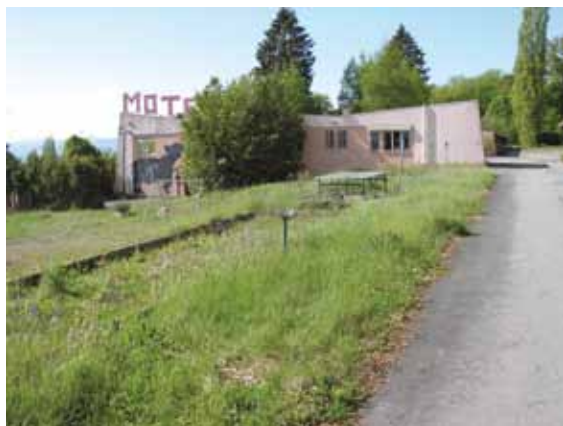
L'emplacement du futur magasin Lidl de Bevaix

Un projet qui ne devrait pas trop enchanter certains commerçants de la région, y compris Coop et Migros!