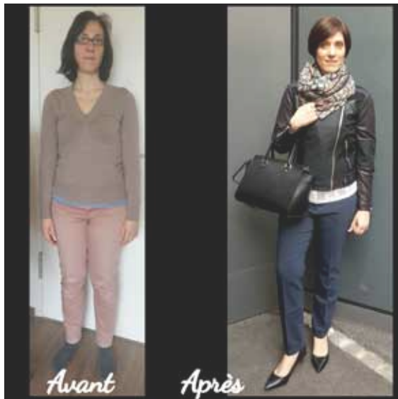
Exemple de relooking avant et après

Que vous soyez une personne publique, cadre, indépendant, employé, à la recherche d'un emploi, étudiant ou femme au foyer, vous communiquez chaque jour de votre existence avec votre image. Chacun possède en lui un réel capital beauté et il suffit souvent bien peu pour le révéler. Dans ce contexte, beaucoup