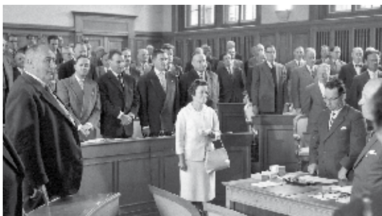
Raymonde Schweizer, 1ère femme au Grand Conseil cantonal en 1960 à Neuchâtel

Tous les lieux et horaires de ces événements sont à retrouver sur: → www.ne.ch/opfe