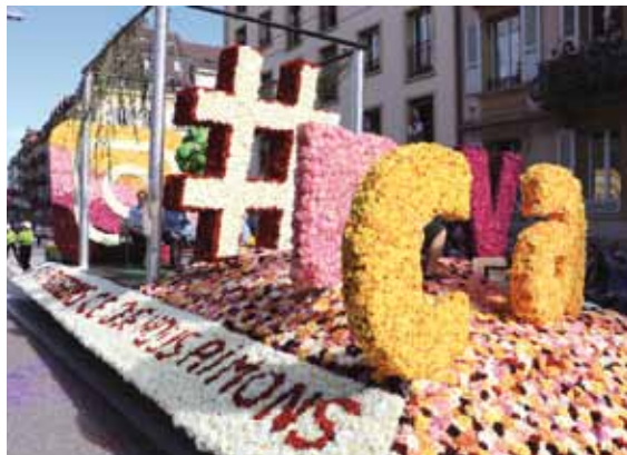
25 ans de Bio Neuchâtel, char de la CNAV décoré de dahlias bio d'Areuse