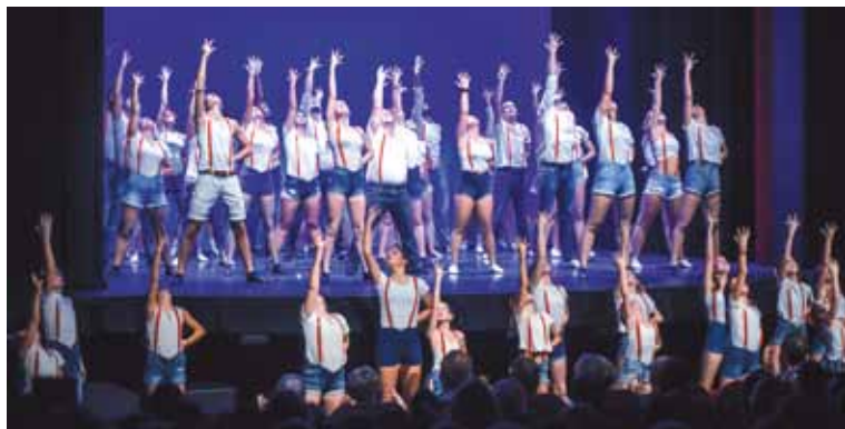
Le final 2018