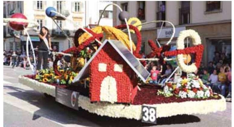
Joli char de la Maison Gottburg à Boudry