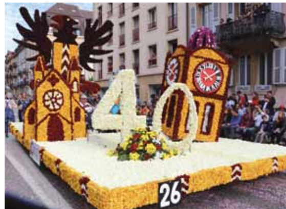
Neuchâtel, 40 ans de zone piétonne