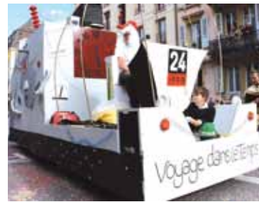
L'Amicale des Pompiers de Boudry et sa machine à remonter le temps