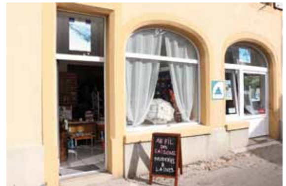
La boutique, rue du Château 11 au centre de Colombier

propres désirs ou faire broder à la main des linges de bain, bavoirs et doudous.